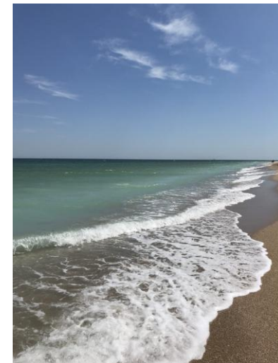
Złote Piaski – brzeg morza