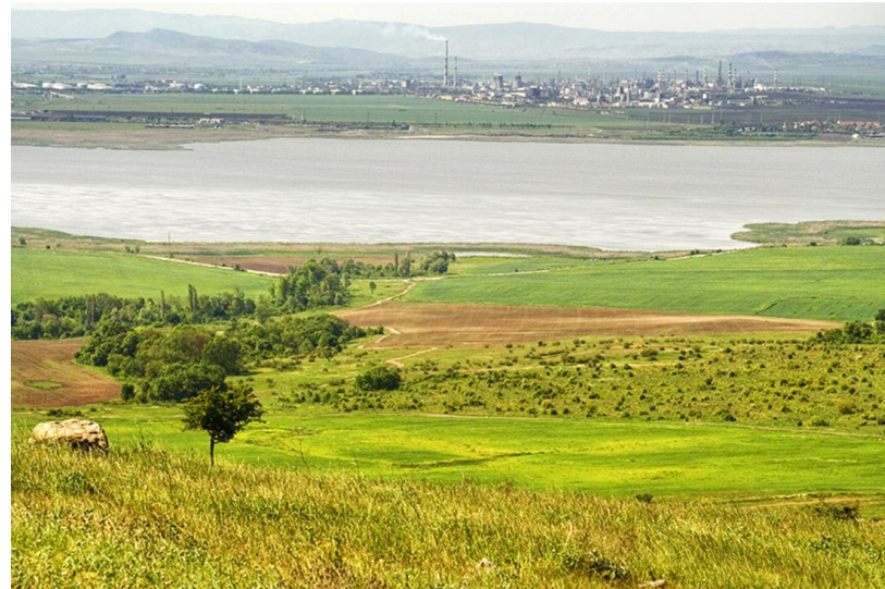
Rafineria oraz tereny rolnicze w okolicach jeziora Burgas