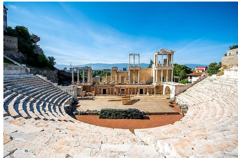
Starożytny teatr rzymski w Płowdiwie

Płowdiw jest uważany za najstarsze nieprzerwanie zamieszkane miasto w Europie (i jedno z najstarszych na świecie). Istnieje od ponad 8000 lat, co oznacza, że tętniło życiem na długo przed powstaniem Rzymu czy Aten.