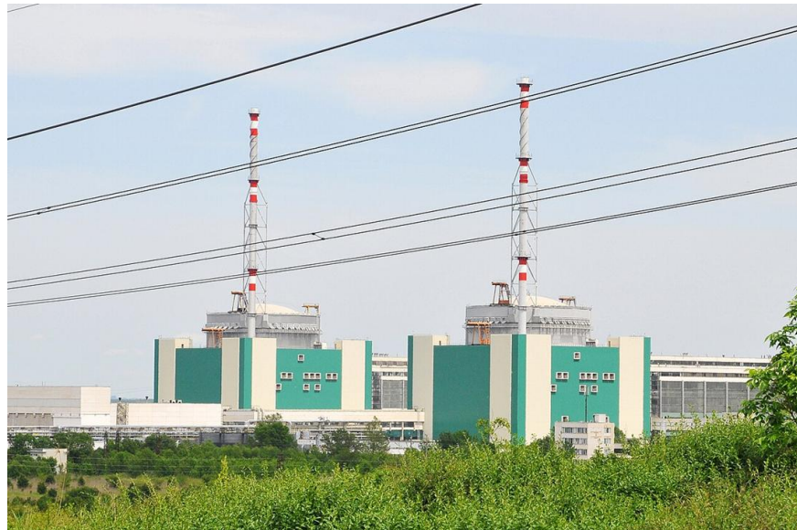
Elektrownia jądrowa Kozłoduj (bułg. Атомна електрическа централа Козлодуй)