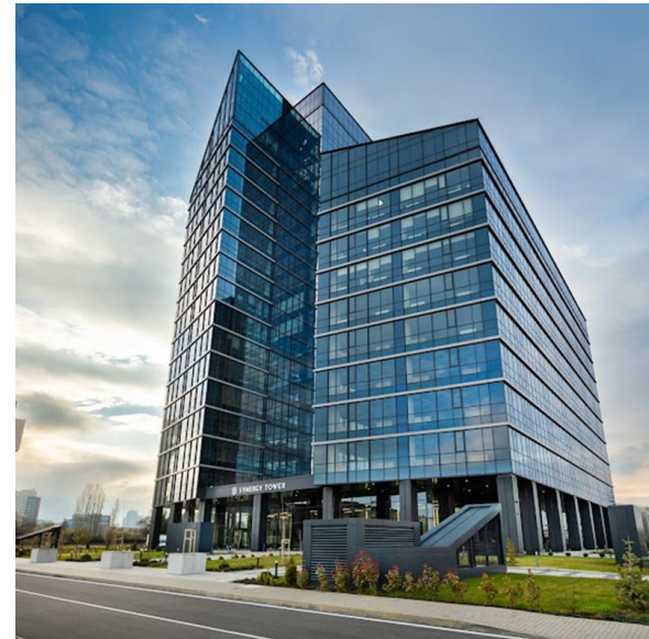
Wieżowiec Synergy Tower w Parku Technologicznym Sofia